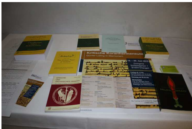
Impressionen zum Empfang nach dem Abendvortrag: